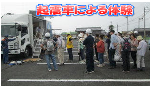
起震車による体験

ルを基準とした初動期の避難所立ち上げから開設に至るまでのプロセスを、実際の状況を想定して訓練しました。