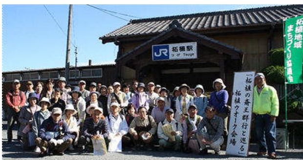
↑当日参加の方も含め、70名が参加しました。

秋晴れの下、徳永寺・芭蕉公園・芭蕉翁誕生宅社を訪れ、柘植公民館に11時30分に到着。昼食と齋王群行の解説を受けた後、多くの方が午後の齋王群行事に参加していただきました。