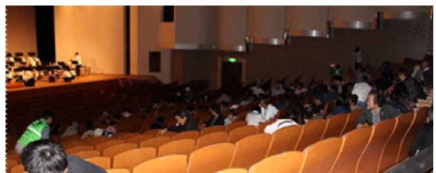
↑うずくまって体を隠す参加者ら

大規模災害は何時襲ってくるか分かりません。必ず来るといって心構えで備えましょう。