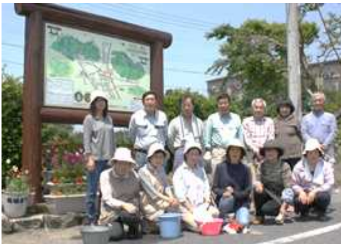
きれいに塗装がされた観光案内板とその下方にある花壇を背景にパチリ!(5月30日)

花壇整備も行いました。季節も変わり温かくなってきたので、夏らしい駅前となりました。