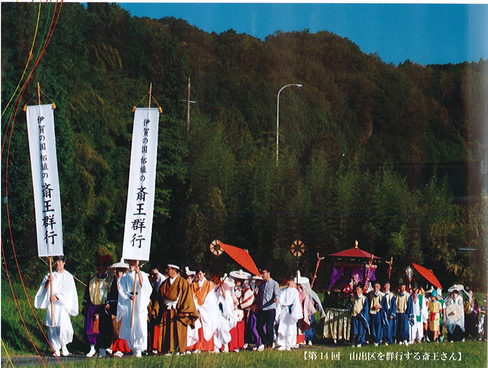
【第14回 山出区を群行する齋王さん】

主催/柘植地域まちづくり協議会・伊賀の国 柘植の齋王群行実行委員会 後援/伊賀市教育委員会、伊賀上野観光協会、上野商工会議所、 伊賀市商工会、中日新聞社、三重テレビ、伊賀上野ケーブルテレビ (公財)伊賀市文化都市協会 お問合せ/伊賀市柘植町10647(柘植市民センター) ☎0595-45-8880