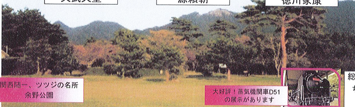
関西随一、ツツジの名所 余野公園