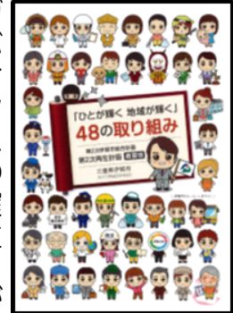
先日、全戸配付された ←第2次再生計画概要版

画』を策定しました。そのテーマの一つに、自治基本条例に基づく「市民」「地域」との協働による分権型まちづくりの推進「ガバナンスの確立」があります。