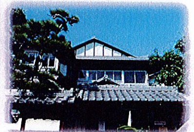
国登録有形文化財（建造物） 旧料理旅館九重本館