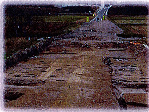
有井遺跡発掘調査（西明寺）