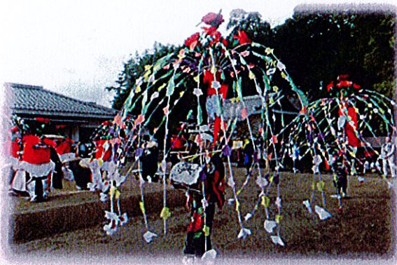
国指定重要無形民俗文化財 勝手神社の神事踊