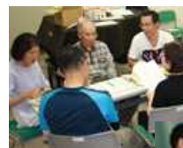
初動リーダー会議 (6月29日)