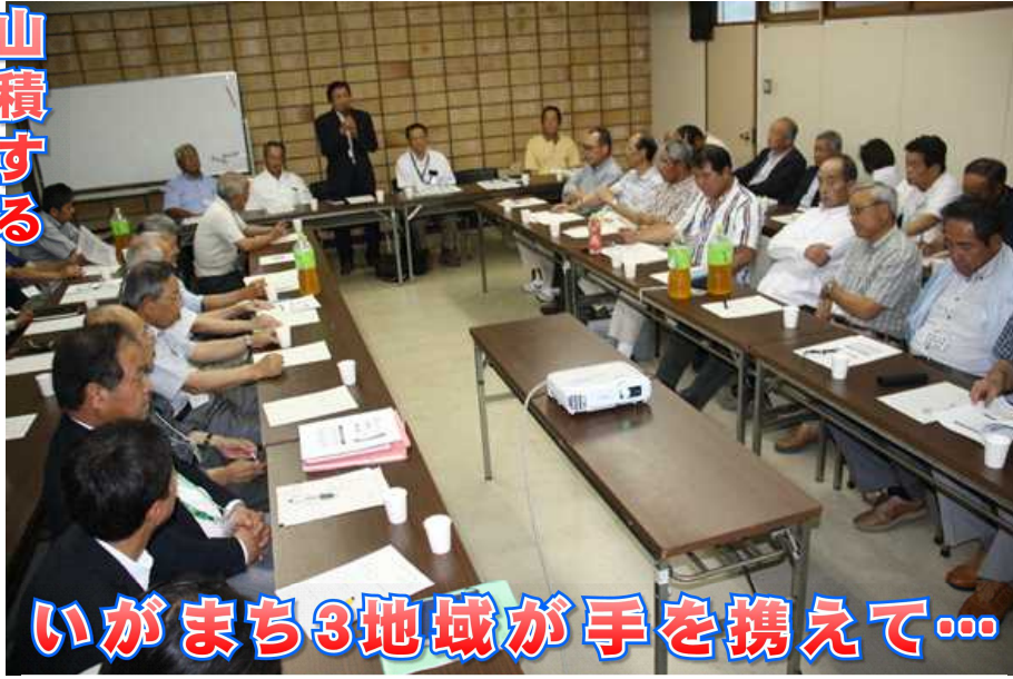
いがまち3地域が手を携えて...