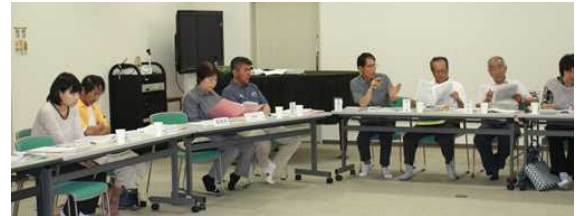
自主防災実行委員会 (6月18日)