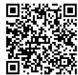
▲伊賀市人権尊重都市宣言

まずは、今号の人権関連の記事について、伊賀市や法務省の関連HPにアクセスしてみましょう。